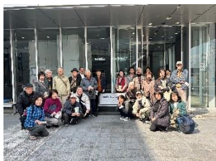
徳島県立防災センター到着

令和5年2月25日(土)防災県外研修で、徳島県立防災センターを訪問しました。参加者25名。消火体験、風速30m体験、煙体験などを体験し、もしもの時の身の守り方をクイズ形式で学習しました。研修後大鳴門橋遊歩道「渦の道」を散策し、渦潮の絶景を堪能しました。