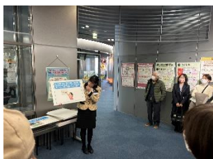
地震発生!〇〇の時どうしますか?